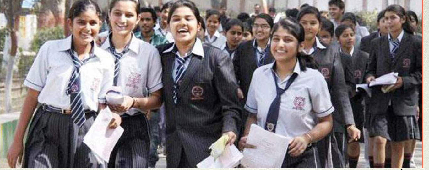
પાના નં. ૧૨