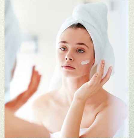
પાના નં. ૨૬

દૂધ અને મલાઈ કરશે દાગ, ઘબ્બા ને શુષ્ક ત્વચાની સફાઈ